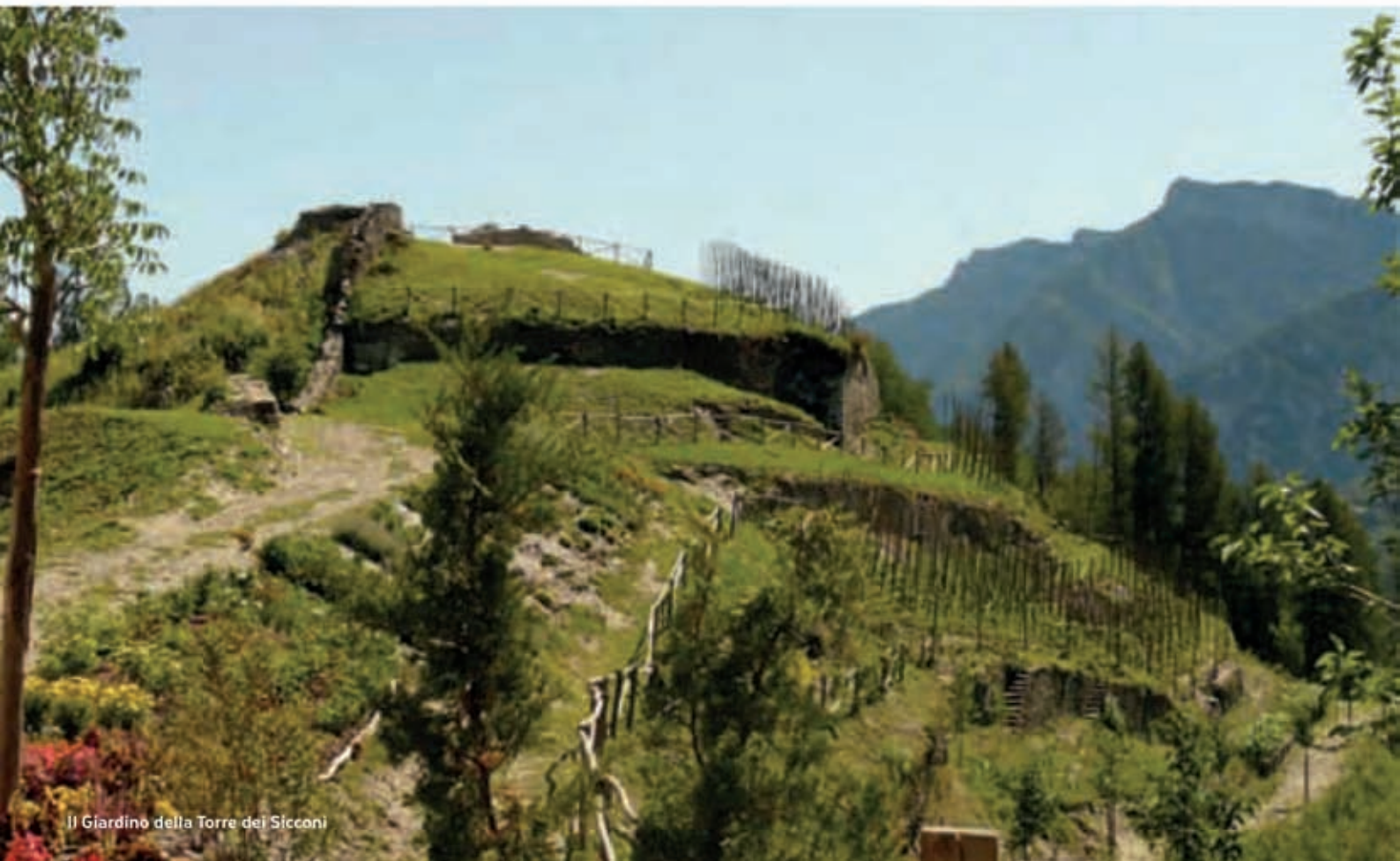
Il Giardino della Torre dei Sicconi